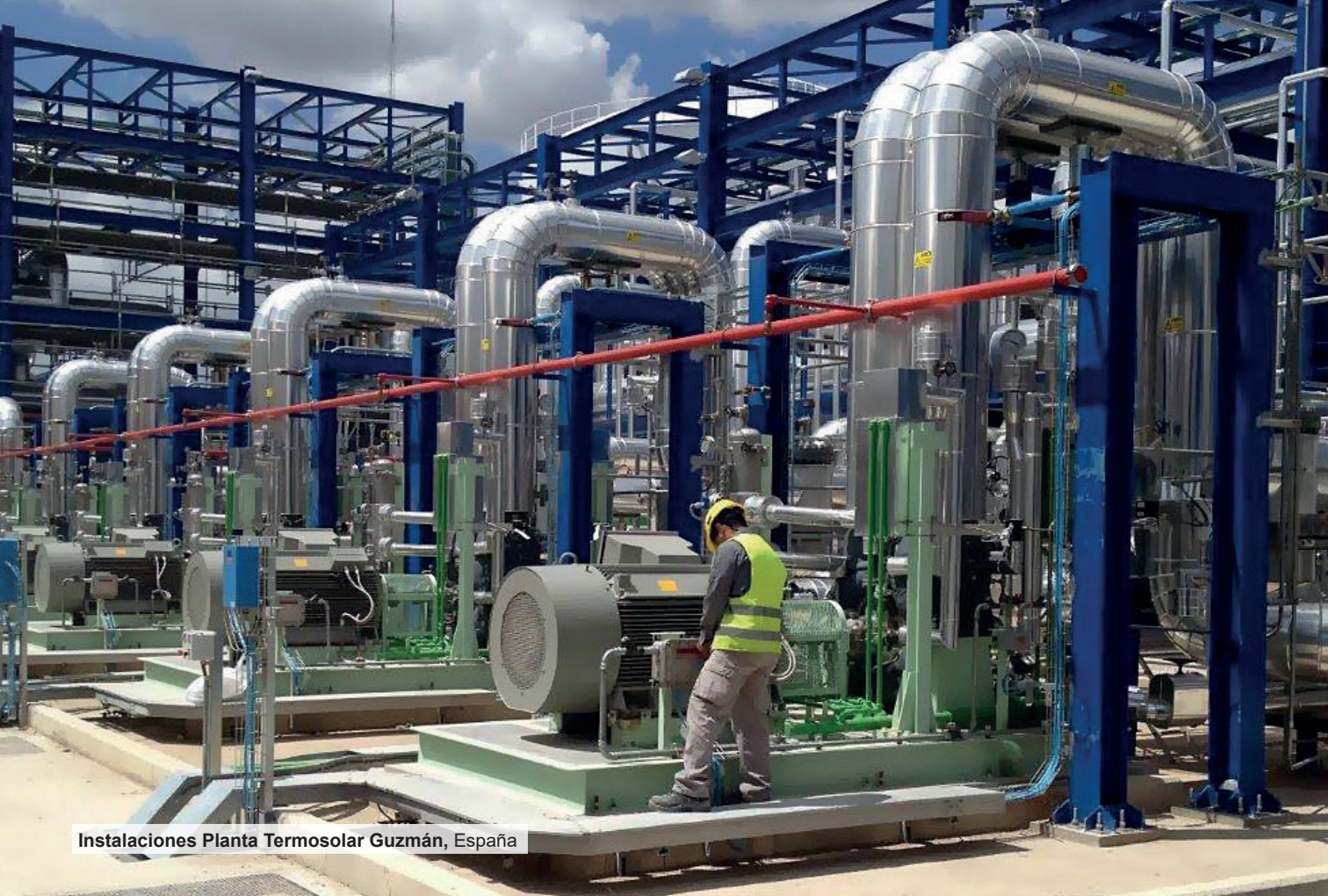
Instalaciones Planta Termosolar Guzmán, España