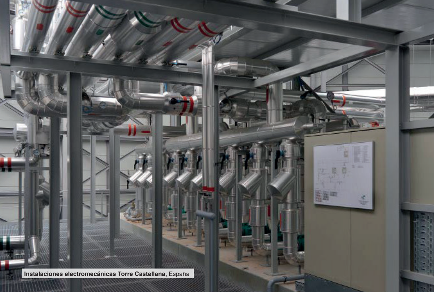
Instalaciones electromecánicas Torre Castellana, España