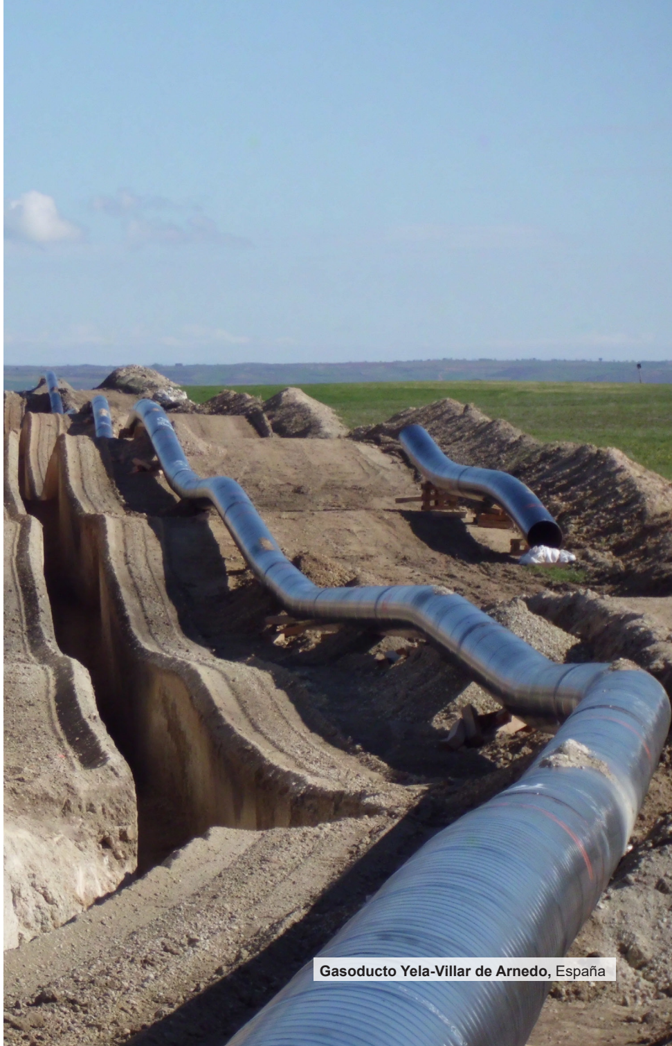
Gasoducto Yela-Villar de Arnedo, España