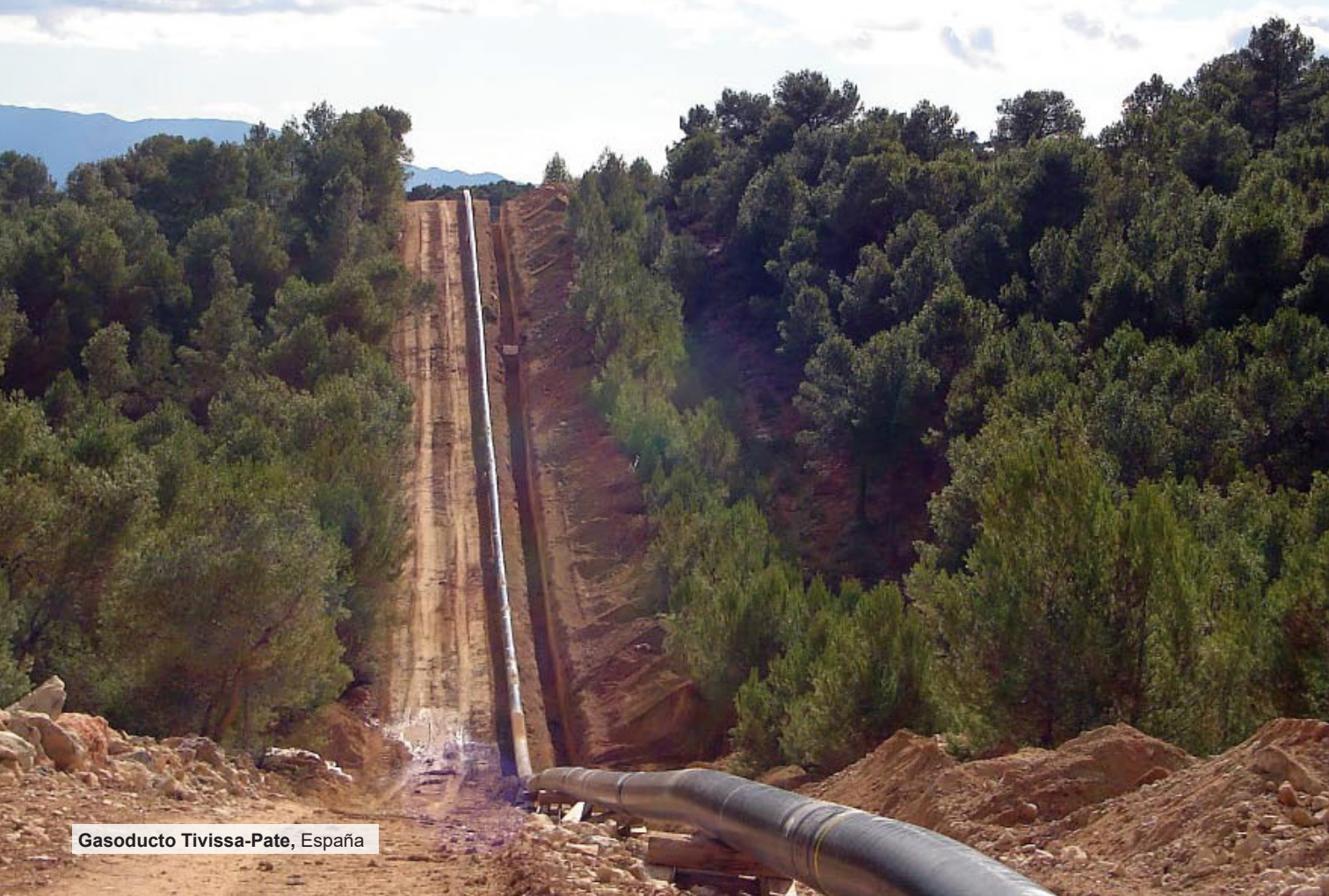
Gasoducto Tivissa-Pate, España