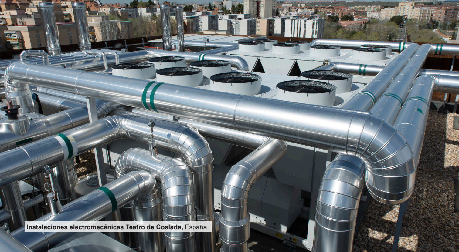
Instalaciones electromecánicas Teatro de Coslada, España