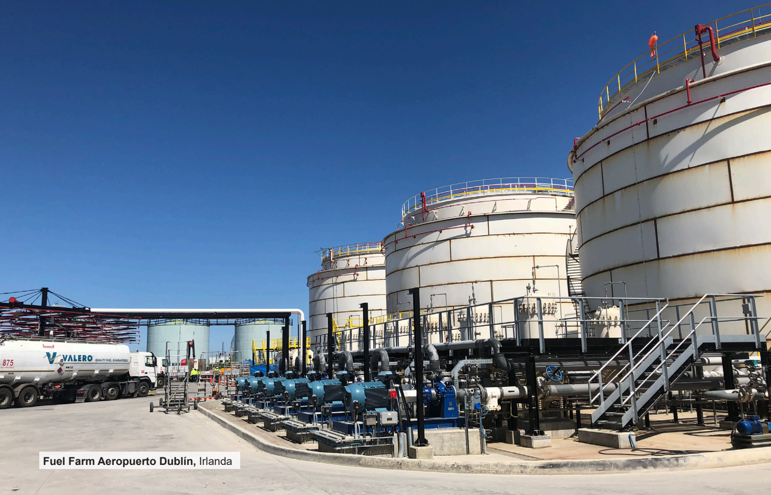
Fuel Farm Aeropuerto Dublín, Irlanda