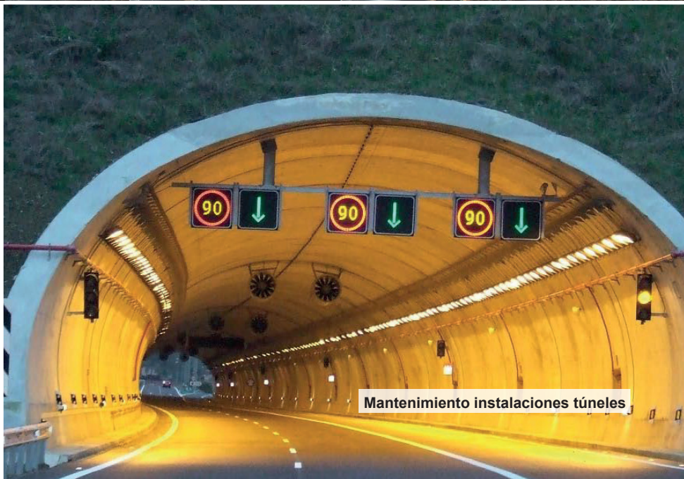
Mantenimiento instalaciones túneles

Operación y mantenimiento de redes MT y BT.