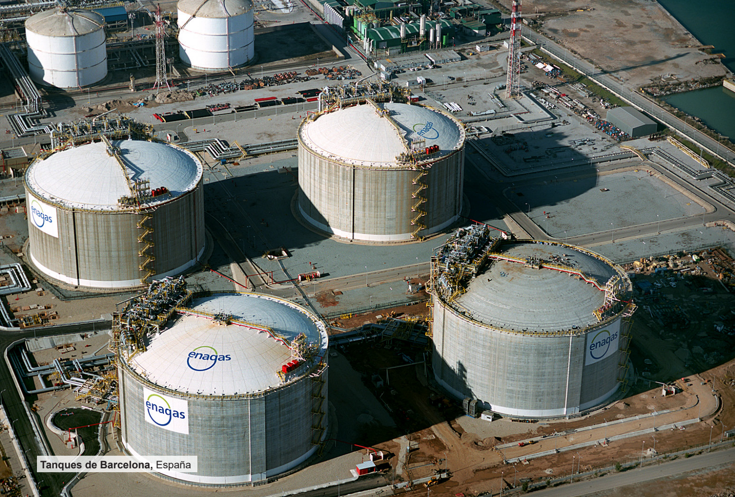
Tanques de Barcelona, España